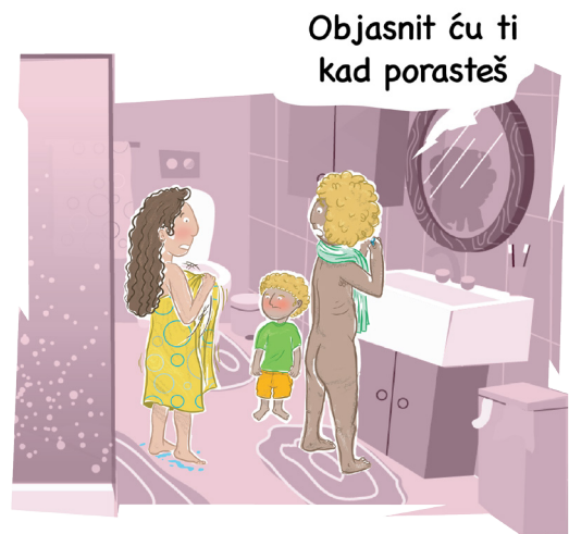
Idi na stranu 7!