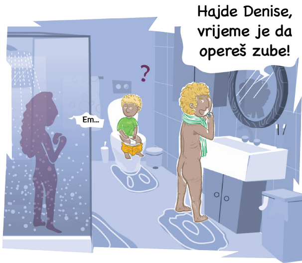
Idi na stranu 4!