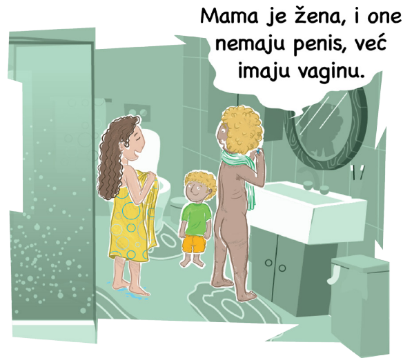
Idi na stranu 5!

Muški spolni organ se zove penis, žene imaju drugačije genitalije. Ženski spolni organ na površini se zove vulva, dok je vagina u unutrašnjosti. Na taj način ...."