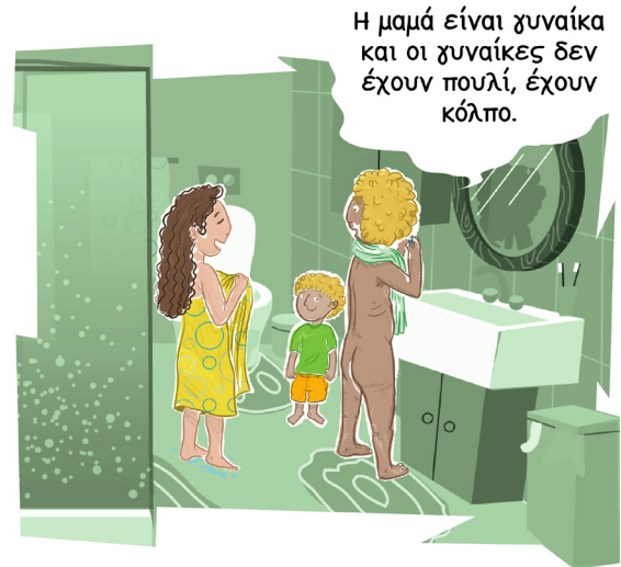
Πηγαίνετε στη σελίδα 5!