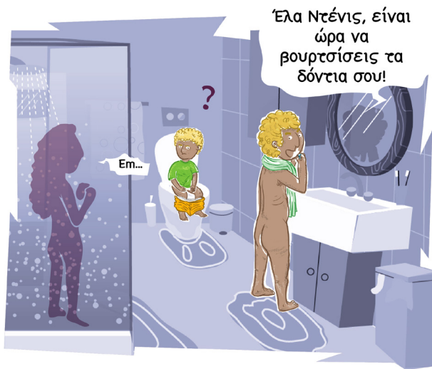
Πηγαίνετε στη σελίδα 4!