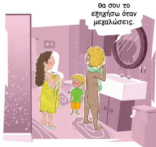
Πηγαίνετε στη σελίδα 7!