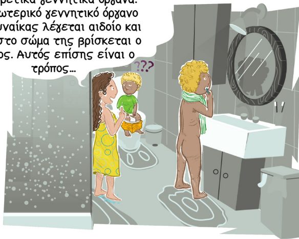
Πηγαίνετε στη σελίδα 6!