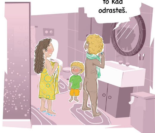
Idi na stranicu 7!