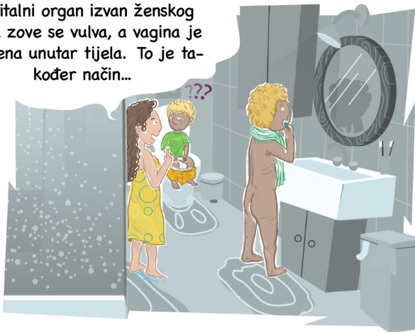
Idi na stranicu 6!