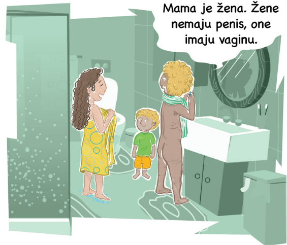
Idi na stranicu 5!